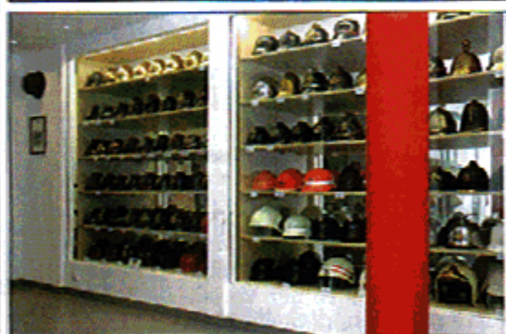
Eine Vielzahl prachtvoller Sammlerstücke aus dem 19. und 20. Jahrhundert findet sich im neuen Feuerwehrhelm-Museum in Gais – und die Besucher sind begeistert davon.

eine Zeitlang davon Zugführer. So war es fast eine logische Folge, dass auch Franz Josef