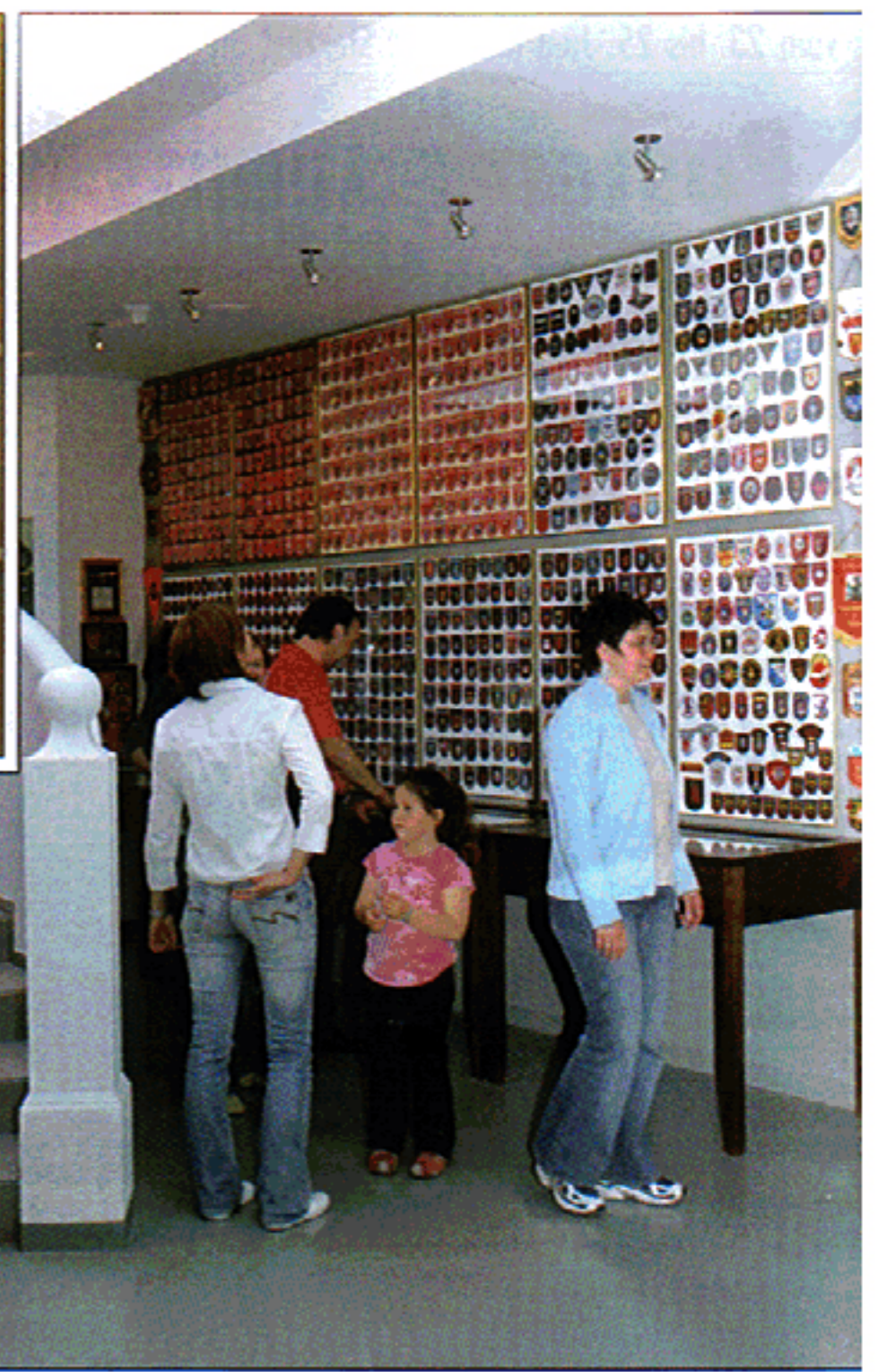
Feuerwehrhelme aus aller Herren Länder finden sich im Untergeschoss des Gaiser Hotels „Burgfrieden“. Für Auflockerung sorgen Uniformen, etliches Zubehör und Ärmelabzeichen.

chenkunst verwöhnt wurden und schließlich noch je einen ledernen Feuerwehrhelm aus Ägypten ausgehändigt bekommen.